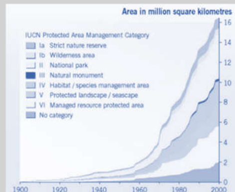
Viele Indikatoren (hier zum Beispiel: Schutzgebiete der Erde) belegen, dass Naturschutz große wirtschaftliche Möglichkeiten bietet. / Many indicators (here, for example, protected areas of the earth) show that nature conservation offers great economic opportunities.